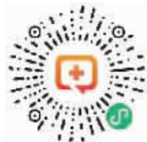
居民预约 接种二维码