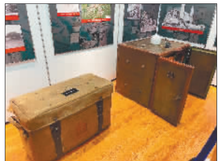
市民捐赠的“兽医拔一号行礼箱”。