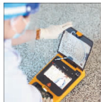
全自动体外除颤仪体积小,非常便携。

据介绍,目前3台除颤仪分别安装在机场新航站楼二楼值机区、一楼进港大厅区以及国际航站楼候机区,一旦有旅客出现心跳骤停等突发状况,可以得到紧急救护。机场已分批对现场工作人员进行了培训,确保在紧急情况发生时工作人员能够第一时间取出机器进行急救。通过使用就近的除颤仪设备对患者实施心肺复苏,能够在医护人员到达前为患者争取抢救时间,从而提高患者的存活率。