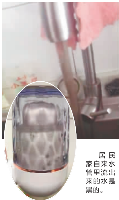
居民自来水管里流出来的水是黑的。

随后记者找到利民开发区自来水公司,客服部工作人员刘先生表示,对于陈先生家的情况,他们将尽快派工作人员