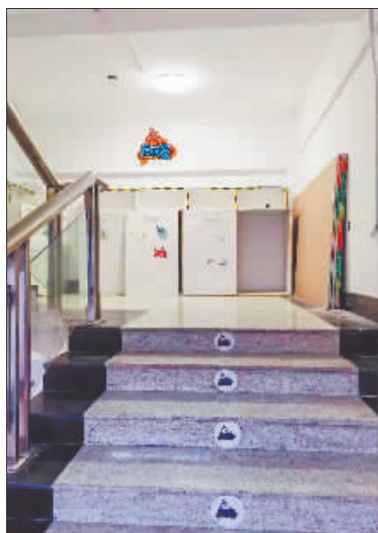
启萌家俱乐部装修停工。

本报讯(记者 黄晏君 文/摄)近日,记者陆续接到哈市部分学生家长反映:位于南岗区黄河路200号的启萌家俱乐部人去楼空,20多名学生家长被拖欠学费6万余元,找到该俱乐部负责人交涉多次仍没解决。