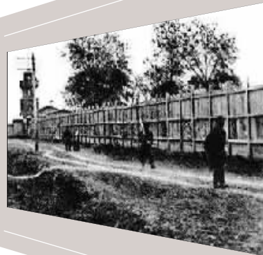
街边的木栅栏和实木电线杆。