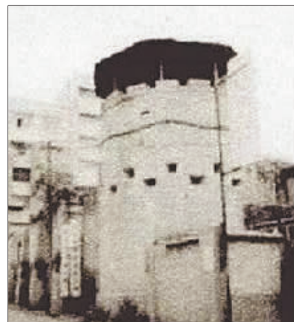
曾位于现今友谊路上的警察局监狱。