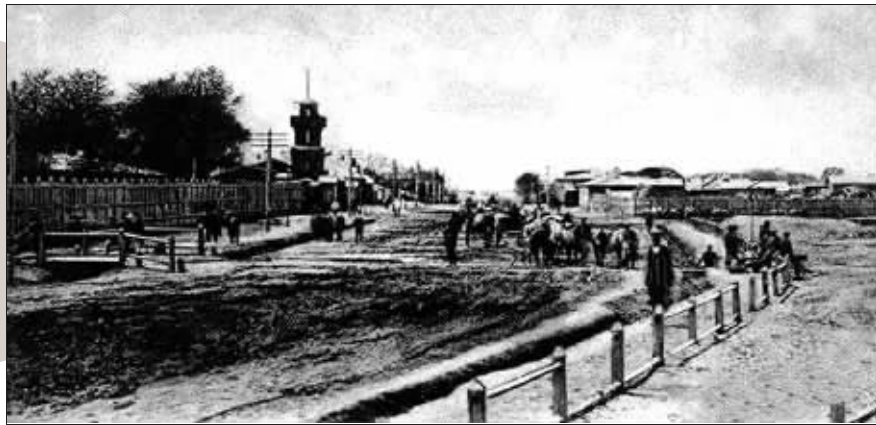
20世纪初期的警察街。

1920年中国政府开始逐步收回中东路和哈尔滨的市政主权，该警察局也同时被接管，1925年改为中文街名，即警察街。