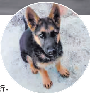
被盗幼犬最终不幸夭折。