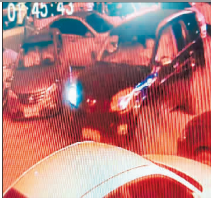
事发现场附近商服的监控拍下了肇事过程。