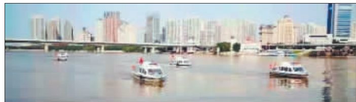
市公安局航运分局民警江上巡逻。

教育部门提醒广大家长,务必增强安全意识和监护意识,切实承担起监护责任,加强对孩子的教育和管理,及时掌握自己小孩的动向,了解他们去干什么、和谁去、何时归,经常进行预防溺水等安全教育,给孩子传授相关知识和技能,不断加强孩子的安全意识和自我保护意识,提高孩子的避险防灾和自救能力,严防意外事故的发生,切实担负起监护人的责任。