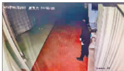
监控拍下了嫌疑人的作案过程。