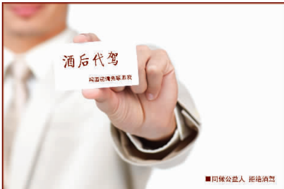
同做公益人 拒绝酒驾

据介绍,尚志市2021年城镇老旧小区改造项目正紧锣密鼓加快推进,共涉及47个小区、52栋楼体、2987户居民,改造建筑面积27万平方米,已开工36个小区、42栋楼,计划2021年10月15日完工。