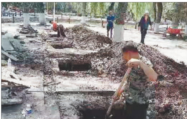
建国公园升级改造进行中。

为防止建国公园外围栏拆除后出现损坏绿篱、随意进出、随意便溺等不良行为,提升建国公园周边环境秩序,相关部门将成立以综合行政执法局为主,建国派出所、建国公园、建国街道办事处、公园社区为辅的管理队伍,还将在特定位置安装智能化设备,在园周边安装配高清监控探头。