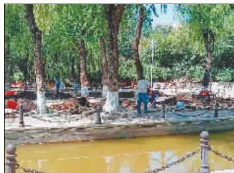
今年,哈市又完成了5座公园外围栏拆除工作。

市城管局相关负责人表示,下一步将组织园林部门进一步强化全市开放式公园的日常管理,保证公园安全有序运行,为广大市民提供整洁优美的休闲环境。