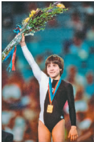
15岁时的丘索维金娜

25日,东京奥运会体操女子资格赛结束,46岁的乌兹别克斯坦体操名将丘索维金娜完成了职业生涯的谢幕演出。曾经拼命参赛以赚取奖金为重病儿子治疗的故事,让世界认识了这位“体操妈妈”。在儿子痊愈后,对于体操运动深沉的爱又支撑着她继续留守在这块赛场,一晃就是四年又四年。她的经历已经远比很多人看到得要鲜活亮丽。