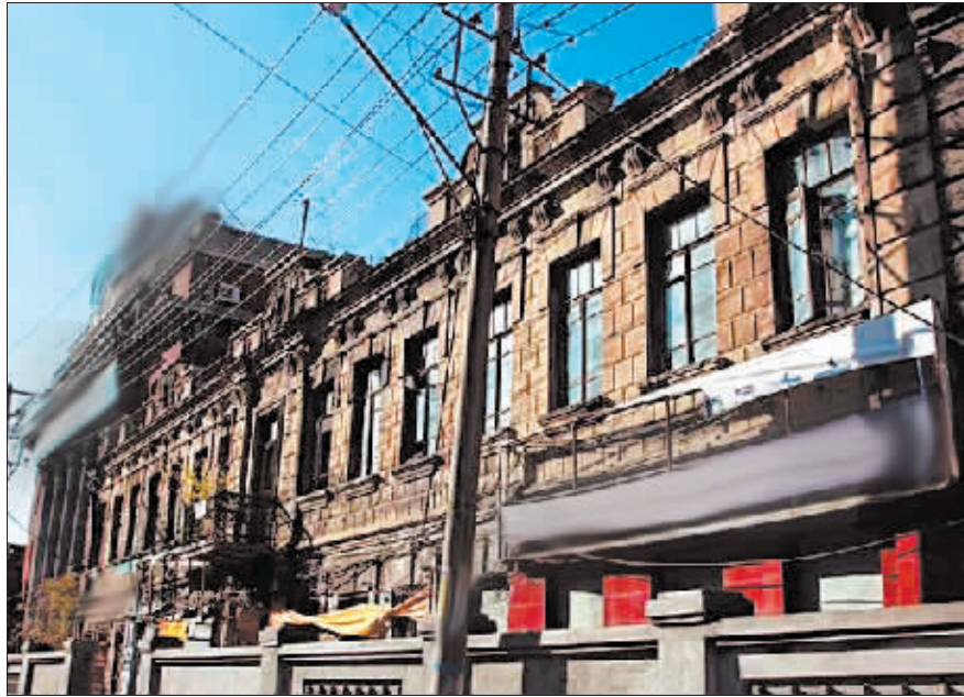
当年的永衡官银钱号旧址,现已成为保护建筑的道外区北四道街26号。

到了20世纪20年代,道外正阳街(现今靖宇街附近的北三至北四道街)一带,逐渐发展成了哈尔滨的金融中心,早期官银号、大银行、交易所等中资金融机构多汇聚于此,在当时颇具影响力。