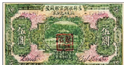
吉林永衡官银钱号发行的哈大洋。

银行并称为哈尔滨的“六行号”,这些中资银行、银号的接踵而至,标志着哈尔滨近代民族金融业的开始。