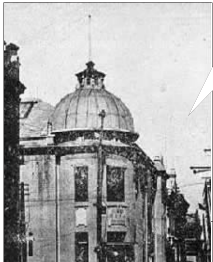
当年的中国银行哈尔滨分号。