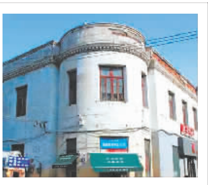
中国银行哈尔滨分号旧址现状。