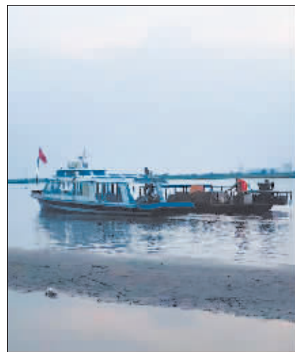
救援人员将遇险船只拖拽上岸。