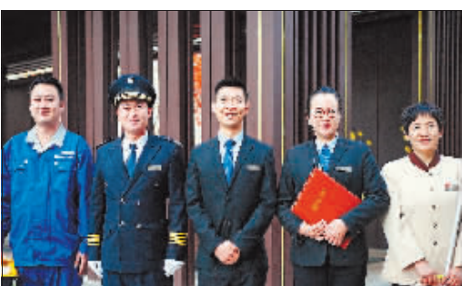
欣汇龙物业专业服务团队。