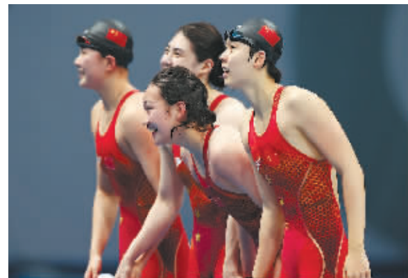
与队友一起夺得接力冠军