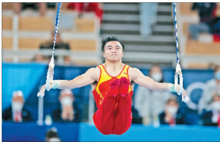
刘洋 男子体操吊环

在2日下午进行的东京奥运会体操男子吊环决赛中,中国选手刘洋得到15.500分,加冕新一代“吊环王”,为中国体操队拿到了本届奥运会的首金,这也是中国代表团第26枚金牌。