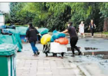
餐馆服务员正在用小车载倾餐厨垃圾。