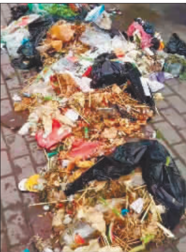
小区内的垃圾转运场餐厨垃圾遍地。