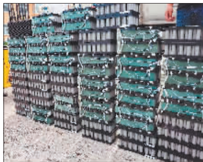
共享单车零件被拆下分批摆放。

经大量工作,警方共发现可疑车辆10余辆,逐一排查后确定了具有重大作案嫌疑的车辆。根据车辆登记信息,警