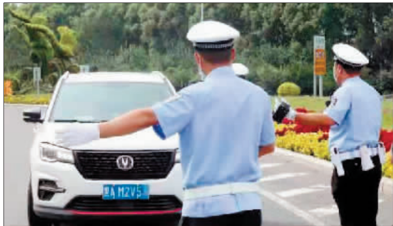
交警取缔违法车辆。

本报讯(吴凡 实习生 赵高飞 记者 王骁)十次事故九次快,许多惨烈的交通事故都与“快”分不开。8月5日,哈市交警部门对全市高速公路、国省道超速等交通违法行为进行集中整治,通过现场处罚、即时教育、强化警示,提升广大驾驶人安全守法意识。当天,交警部门共查处超速驾驶113件、疲劳驾驶6件。