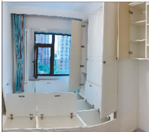
消费者购买的“我乐”家具。