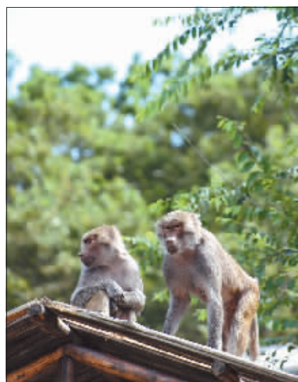
在屋顶陪你一起看风景。

在人工湿地湖生活的戴冕鹤,头顶锦冠,在阳光下金光闪耀,十分引人注目。漂亮的戴冕鹤情侣们总是形影不离,喜欢在植物丰盛的小溪流边散步、嬉戏、寻觅美食,高兴的时候用歌声表达欢愉,抒发情爱,还会甜蜜热吻,随时随地秀恩爱。