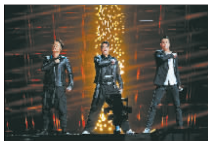
星光闪烁的初舞台演出。