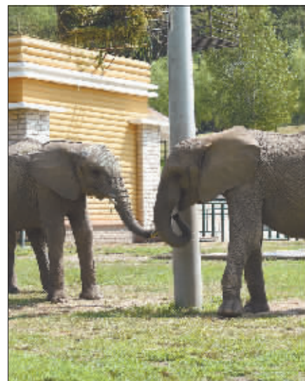
执子之手,与子偕老。