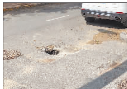
生活中各种小隐患常隐藏大危险。