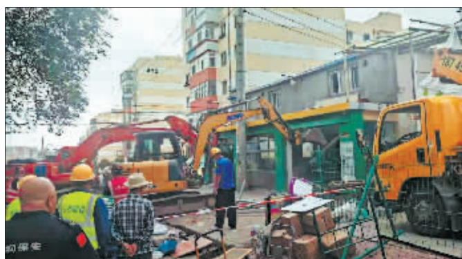
军民街1200余平方米违建拆除现场。

8月15日，香坊区综合行政执法局与多部门联合执法，出动30余人，利用4台大型机械，对位于香坊区军民街仁和家园小区附近的约1200余平方米违法建设实施拆除。现场执法人员告诉记者，执法人员根据建筑物的地理位置和特点，采取吊装为主、破拆为辅的拆除办法，尽量减少建户的损失，并耐心做好当事人思想工作，以公开透明的方式对执法过程进行了全程记录。