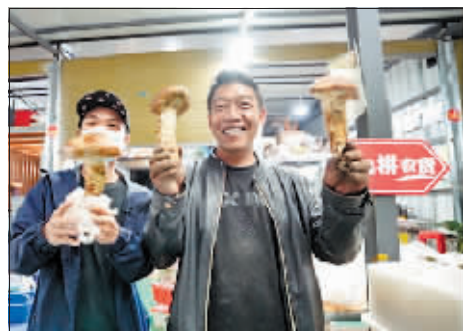
此次“农货节”期间,云南香格里拉藏民采摘的新鲜松茸,在拼多多全程冷链物流的加持下,最快48小时即可送到消费者的餐桌。

遇。今年一季度,拼多多平台农产品订单同比增长超过300%,单品订单超10万+农产品达到2645款,直连农户数超过1600万。作为国内最大的农产品上行平台,拼多多自创立以来,一直积极扎根农业,先后探索出“产地直发”“农地云拼”等多种助农模式,助力各大农产区直连全国8.24亿消费者,为各地农产品打开了新的销售渠道,提升农产品的附加值,带动农户增产增收。此次“农货节”的负责人表示,未来5年,拼多多还将继续通过与地方政府和农业机构合作,推动新农人返乡创业,并加大对农户的技术培训,用技术赋能农业生产,助力乡村振兴。