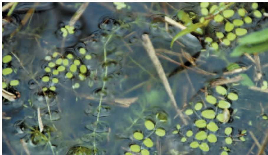
被称为“水中捕蝇草”的貉藻。

不是只有虫子吃植物,植物有时也能“反咬一口”。提到捕蝇草,大家可能都熟悉,它凭借独特的外观和神奇的捕虫能力扬名天下,但说起貉藻,你可能会问:这是什么?貉藻是《国家重点保护野生植物名录》中,唯一一种保护级别被列为I级的食虫植物,被称为“水中捕蝇草”。近日,东北林业大学调查人员在我省一处湿地保护区发现了貉藻,而且种群数量不小,这将为进一步研究该物种的栖息环境和分布提供重要帮助。