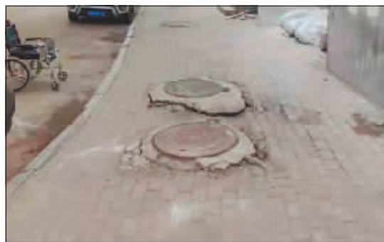
窨井盖高高凸起足有10厘米。

针对这些情况,记者联系到负责该小区物业管理的瑞星物业,负责人孙主任表示,小区现在正由政府组织进行统一的消防改造,路面打算改造完成后统一修复,时间不会太久。树木修剪以及喷泉池的积水、卫生问题,他会立即派人处理。