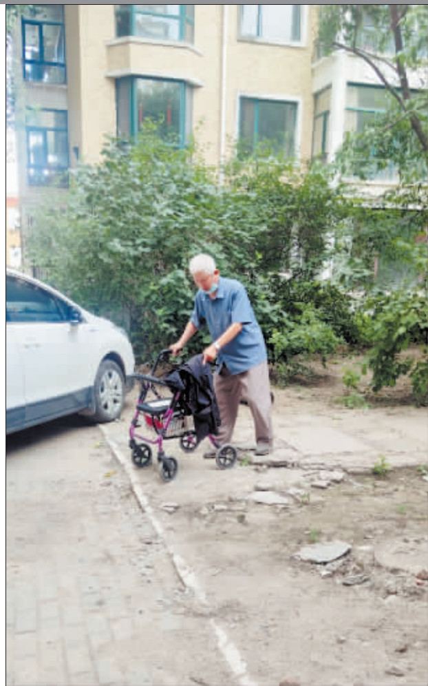
小区路面坑洼不平。