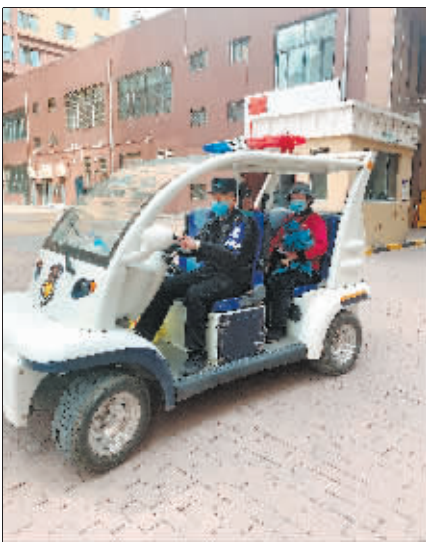
安防员接送行动不便的业主。

创造前所未有的价值”的企业核心价值观与“不断超越业主满意期待值”的质量坚守,积极探索“红色物业”,聚力业主幸福生活,努力为业主提供更优质的服务,打造更和谐的社区。