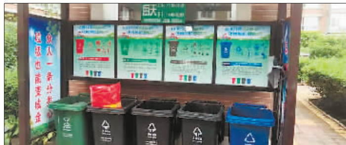
走近垃圾分类点,就会播放语音。

据悉,香坊区生活垃圾分类领导小组办公室与科技企业联合研发了智能语音设备,投用到垃圾分类优秀示范片区、分类箱房岗亭、工企单位、学校、分类垃圾流动收集车等投放密集区域。据香坊区垃圾分类办负责人介绍,该智能语音设备使用太阳能发电板供电,通过红外线感应装置启动。当市民靠近垃圾分类箱房投放垃圾时,语音自动播放垃圾分类投放相关知识,市民投放时即可按提示进行分类投放。