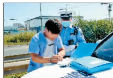
疲劳驾驶的司机接受处罚。

车并未申请牌照,也没有考取摩托车驾驶证,民警立即将车辆扣留,并将驾驶人带回大队进一步处理。随后,执勤警力在现场又取缔了三四台违法车辆,存在无牌无证、违法载人、不佩戴安全头盔等交通违法行为。