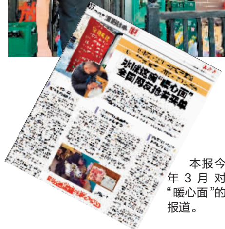
本报今年3月对“暖心面”的报道。