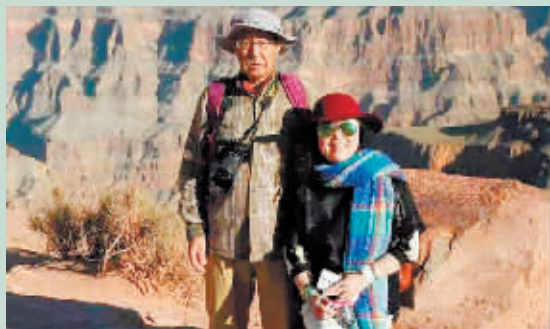
新晚报制图 田宇阳