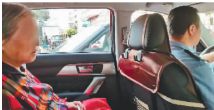
志愿者送老人回家。

了解情况后,周健找来两位志愿者,3人小心护送老人来到新志社区所辖小区,一栋楼一栋楼的排查,终于找到老人的女儿家。