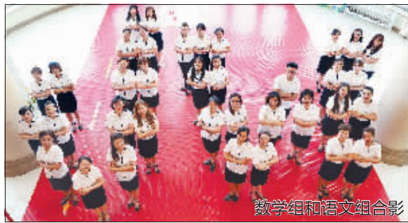
数学组和语文组合影

在教育改革大潮推向二十一世纪的今天，经纬小学以开阔的视野、超前的意识、深刻的思考走出了一条特色发展、文化育人之路。在学校“睿智灵动、思辨创新”课程文化理念的引领下，形成了尚德尚学、求真求实的教师文化。