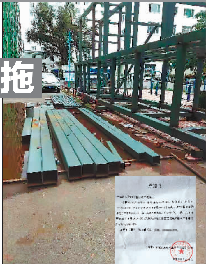
省中医药大学家属楼21号楼2单元的加装电梯施工现场。