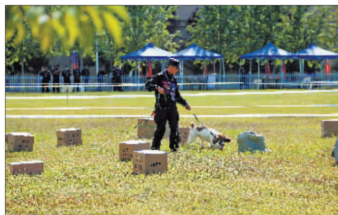
兄弟，仔细点，看看哪个箱子里有毒品。