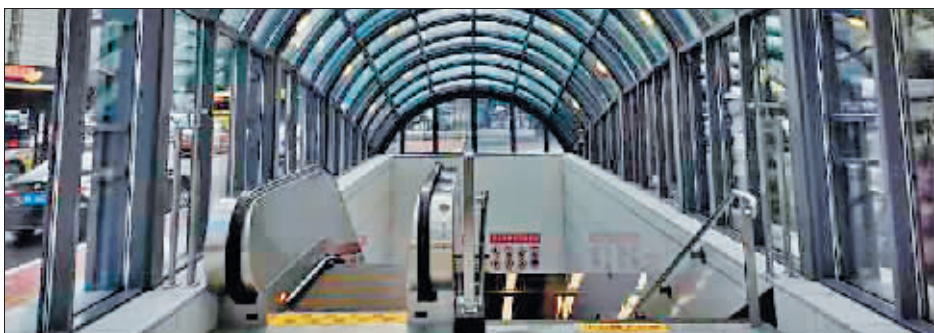
地铁2号线车站。

2021年中秋和“十一”节假日期间,哈尔滨地铁1号线、2号线、3号线(一期)晚间运营时间延长至23时。