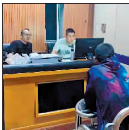
犯罪嫌疑人接受民警讯问。

二十年间,冯建朝从一名30岁的青年民警变成了50岁的老警,头发也早已泛白。“不把他抓到,我这刑警生涯没法结束,结束了也不圆满。”冯建朝说。