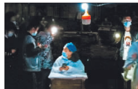
我用手机照亮夜色。