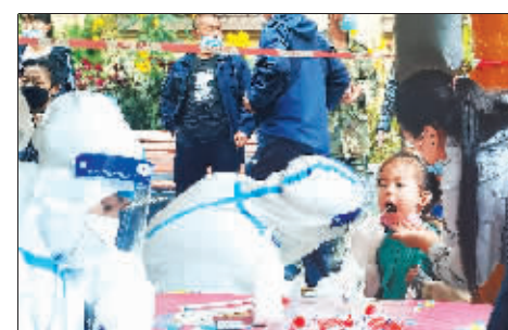
全员检测,有我一份。