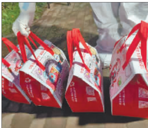
爱心奶茶送给“大白”。