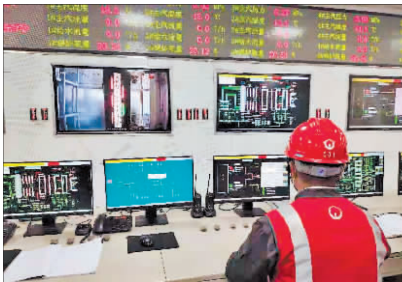
威立雅热电有限公司启动热态运行和平衡调节。

目前,哈投集团旗下9家热企中,金山堡供热公司已于本月7日启动供热系统热态运行,其他热企也将于近期陆续进行热态运行。