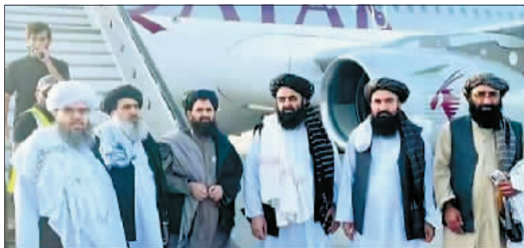
阿富汗临时政府代表团成员。

不过,塔利班发言人沙欣此前接受美联社采访时曾表示,在遏制阿富汗日益活跃的“伊斯兰国”极端组织方面,他们不会与华盛顿合作,称有能力独立对付“伊斯兰国”。塔利班不希望得到美国的反恐援助,并警告美国不要从阿富汗境外对阿富汗领土进行任何所谓的“超视距”袭击。