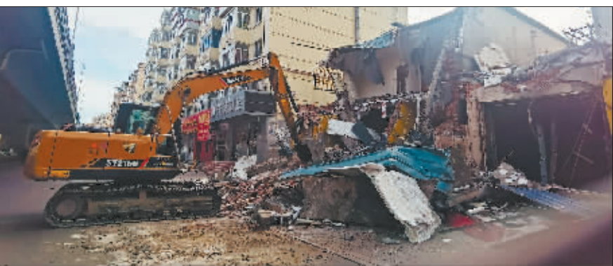
黄河路上200平方米违建拆除现场。

据悉,2021年南岗区违建台账总任务量为101万平方米,截至目前,已完成90.6万平方米。