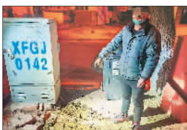
私挖道路现场。

针对近段时间夜间私挖道路行为有所抬头现象,香坊城管服务中心与香坊区执法局进一步加大了夜间巡