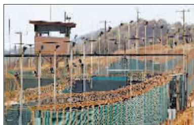
古巴关塔那摩美军基地外景。

“9·11”恐怖袭击后，美国在关塔那摩海军基地设立监狱，关押抓获的涉恐嫌疑人。奥巴马在任期间承诺关闭关塔那摩监狱。唐纳德·特朗普2017年出任总统后推翻前任做法，保留这座监狱。美军关塔那摩监狱因虐囚丑闻而臭名昭著，一度关押接近800人，如今仍有39名男性在押。