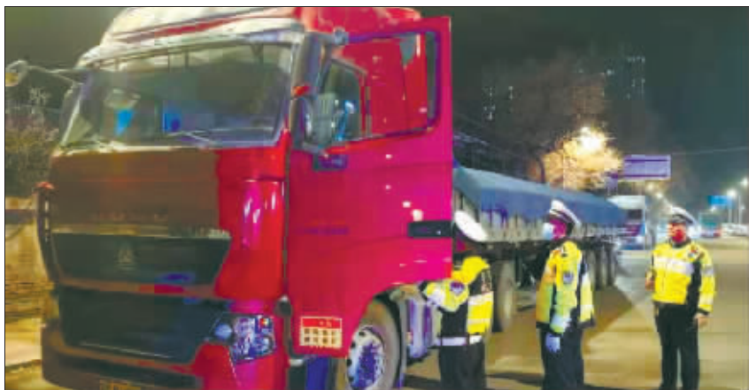
交警夜查大货车。

本报讯(高阳 记者 孙莹)近期,哈市交警部门深入推进全市交通运输行业安全生产风险大排查隐患大整治攻坚行动,重点打击超载超速、闯红灯、逆行、遮挡号牌等违法行为。在10月29日专项夜查行动中查出货车违法180余件,并对近期78辆闯红灯货车进行集中曝光。