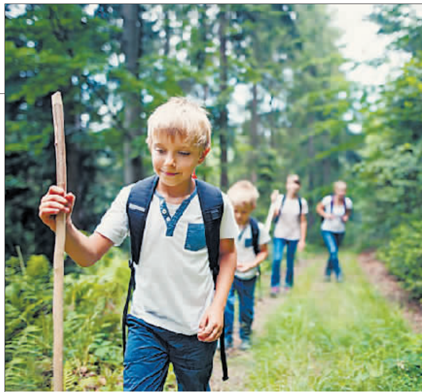
不用大人帮助,荷兰小孩在森林里自寻道路回到营地。

过95%的孩子过完4岁生日就上学了。荷兰小学生假期非常多,每年上课天数只有180天左右,而且这180天里周三和周五只上半天课,小学生没有家庭作业。