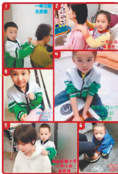
学生们在家做些力所能及的事情。

“课前一练”、“闯关练习”，通过游戏元素增加云端课堂趣味性；巧用问题导线，提高线上教学效率；分层布置，巧设作业，让课后练习提质增效；居家实践，我帮爸爸妈妈做家务，完成劳动实践争做劳动小能手……记者在采访中了解到，近一周来，受疫情影响，哈市中小学校实行线上教学，当线上教学遇上“双减”，各中小学校通过丰富多彩的教学方法让云端课堂保质保量地顺利进行，也让学生的居家学习生活同样精彩。