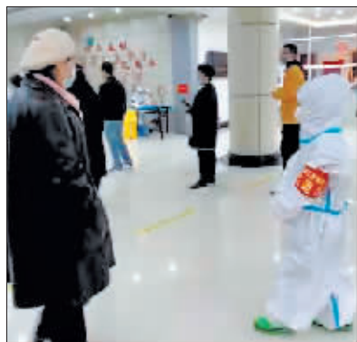
芦杉在核酸检测采样点服务。