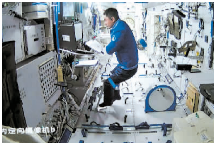
航天员叶光富在核心舱内工作场景。