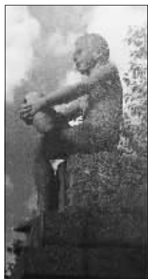
消失的《排球女孩》《小男孩》雕塑。