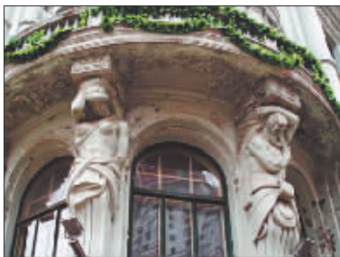
原松浦洋行旧址上的复制男女人像廊柱。

在中央大街与红专街交口处，始建于20世纪初的原松浦洋行旧址，其建筑二楼转角处，有一对大理石男女人像廊柱，堪称那个时期建筑装饰雕塑的代表作品。这对男女人像廊柱姿态优美，其典型的巴洛克艺术风格为整个建筑增加了浪漫主义色彩。20世纪60年代，这对男女人像廊柱被损毁，现存其建筑上的雕塑，是1986年由著名雕塑家杨世昌先生复制的作品。