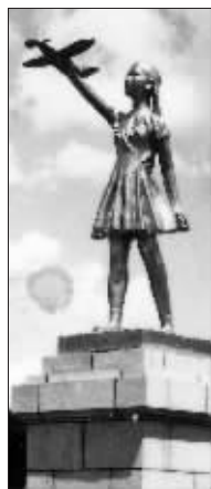
消失的《读书小男孩儿》和《科技小女孩儿》雕塑，如今只能留存在老照片中。

现今，文中提及的雕塑，有的已被当代雕塑家重塑，有的却已经彻底消失了，只能在一些老照片中一睹它们的风采。尽管如此，但只要它们曾经存在过，便永远镌刻进了这片灵性的土地，为这座城市最初的风貌打下了底色，让这里的人永远铭记。