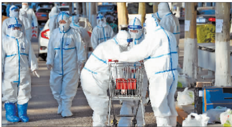
11日,工作人员为北京海淀区富力桃园封闭社区内的居民运送生活物品。

北京市朝阳区人民政府副区长杨蓓蓓表示,朝阳区严密排查管控密接、次密接人员,第一时间落地落人落管控。截至目前,已追踪判定密切接触者152人,次级密切接触者24人,均已落实管控措施。同时迅速有序推进核酸检测,精准筛查重点人群,截至目前,共采样3738人,除上述2名已确诊病例外,其余3736人为阴性。同步采集环境样本402件,除新增病例所在房间8件样本为阳性外,其余为阴性。