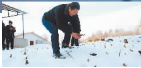
林草局工作人员调查虎踪。

雪天气频繁,这只东北虎出现在村庄附近可能是追踪野猪等猎物。目前,方正当地林业工作人员已及时通过微信提醒附近群众出行注意安全。