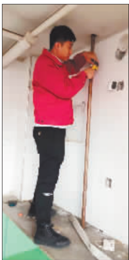
抢修人员修复破损管线。