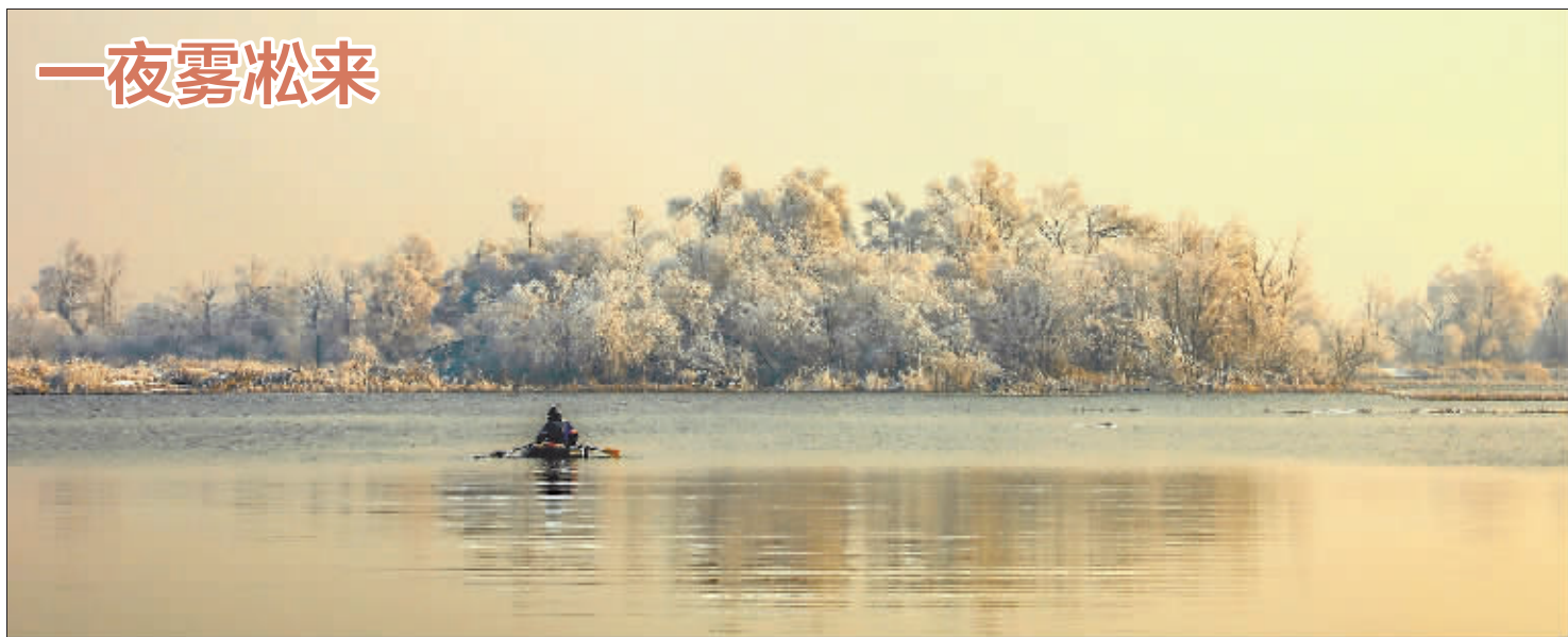
昨天清晨,哈市大雾,刚“脱下”冰挂的枝头,又换上雾凇“新装”,美得恍若仙境。