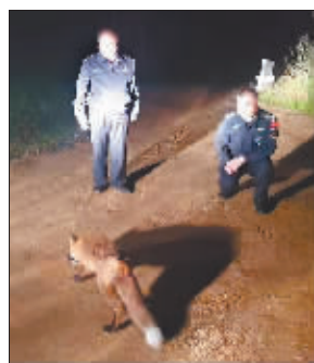
民警巡逻偶遇赤狐。